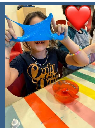
De kinderen hebben hun eigen slijm gemaakt tijdens de wintervakantie