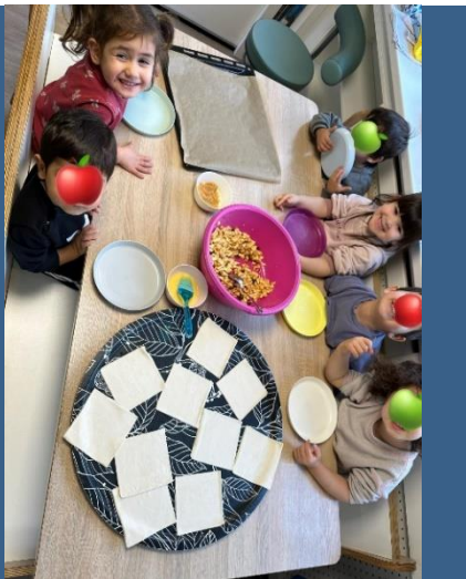
Foto's van activiteiten tijdens de wintervakantie